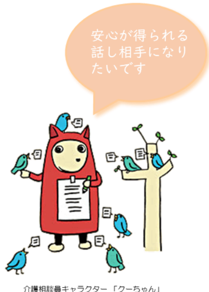
介護相談員キャラクター「クーちゃん」

ただし、車いすへの移乗や食事の介助など「介護」にあたる行為、サービス事業所の評価、利用者同士や家族間のトラブルの仲裁等を行いません。また、「守秘義務」があるため活動上知り得たことは外部にもりません。事業所と共に介護サービスの向上を目指していきます。