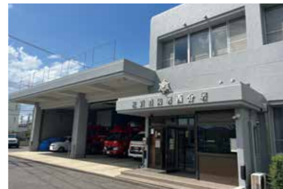
佐賀消防署西分署(外観)

以上の審査を経て、令和4年度佐賀中部広域連合消防特別会計歳入歳出決算は全会一致で認定すべきもの、その他の議案は全会一致で可決すべきものと決定しました。