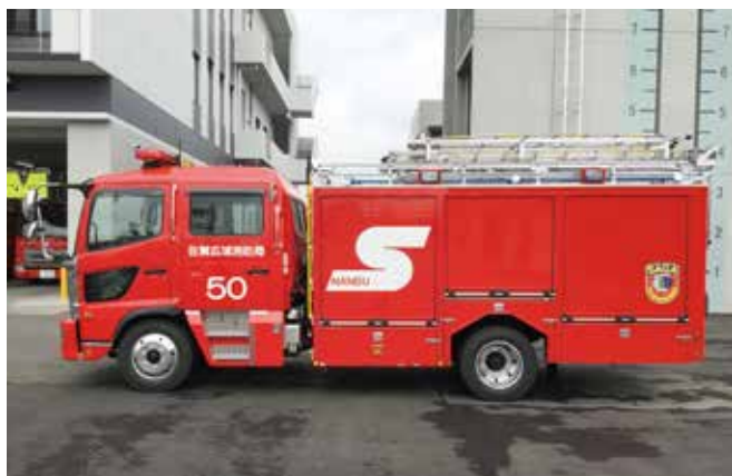
水槽付消防ポンプ自動車Ⅱ型(イメージ)

以上の審議を経て、採決の結果、令和3年度佐賀中部広域連合消防特別会計歳入歳出決算については、全会一致で認定すべきもの、令和4年度佐賀中部広域連合消防特別会計補正予算（第1号）については、全会一致で可決すべきものと決定しました。