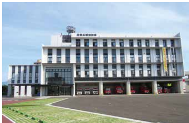
佐賀広域消防局新庁舎