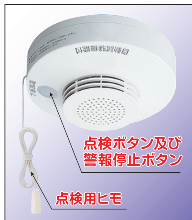
住宅用火災警報器

予防課 (佐賀市兵庫北) ☎0952-33-6765 佐賀消防署 (佐賀市兵庫北) ☎0952-33-6773 多久消防署 (多久市北多久町) ☎0952-75-2191 南部消防署 (佐賀市川副町) ☎0952-45-6442